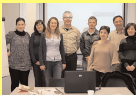
Red de Vida Independiente

FEAPS CV ha hecho un curso sobre Autodeterminación para Familias. Era para los profesionales, para que sepan explicarles qué es eso. SE intenta que las personas con discapacidad intelectual sean lo más independientes posible y se expresen por ellos mismos.